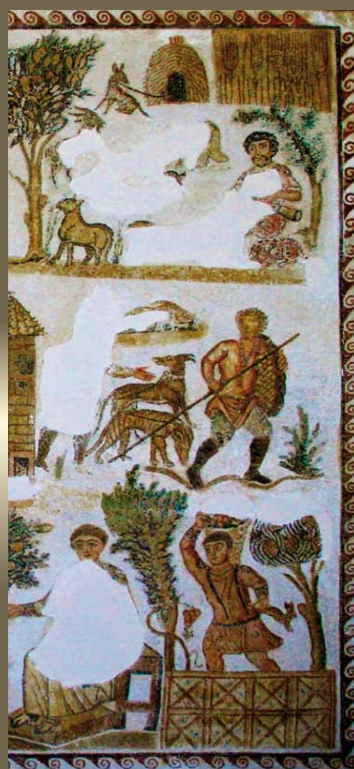
Mosaico della villa del Dominus Iulius, a Cartagine (IV sec. d.C.).

LORENZI comunicazione e pubblicità_Perugia